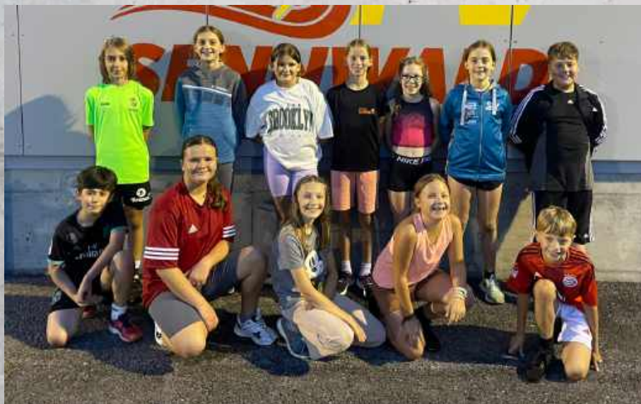
Jugi 3 (Sennwald)