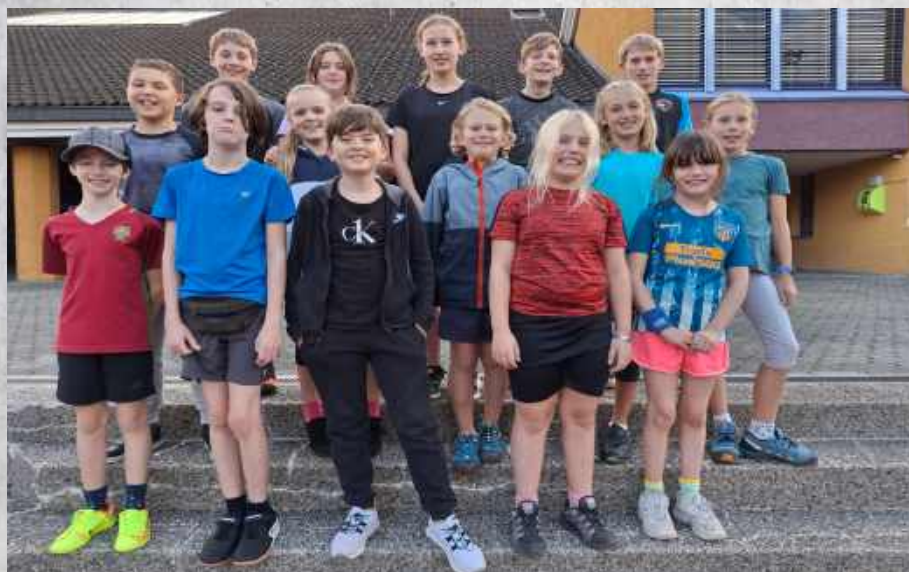
Jugi ab 10 Jahre (Salez)