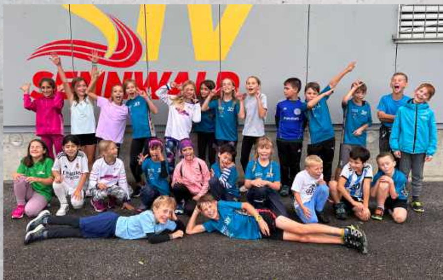
Jugi 2 (Sennwald)