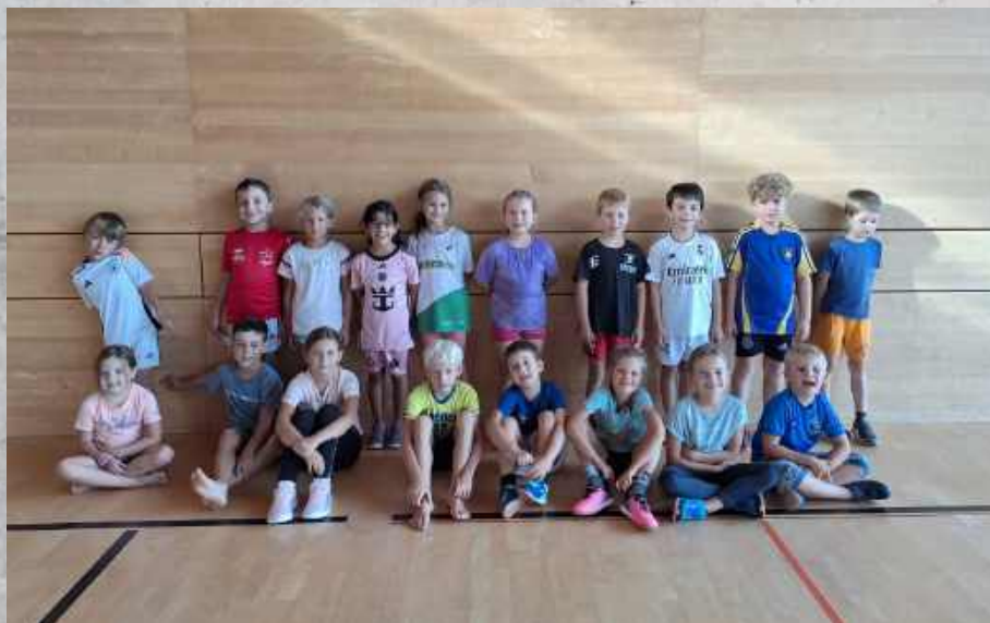
Jugi 1 (Sennwald)