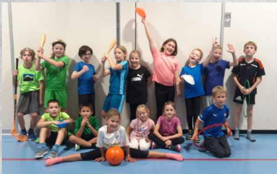
Jugi bis 9 Jahre (Haag)